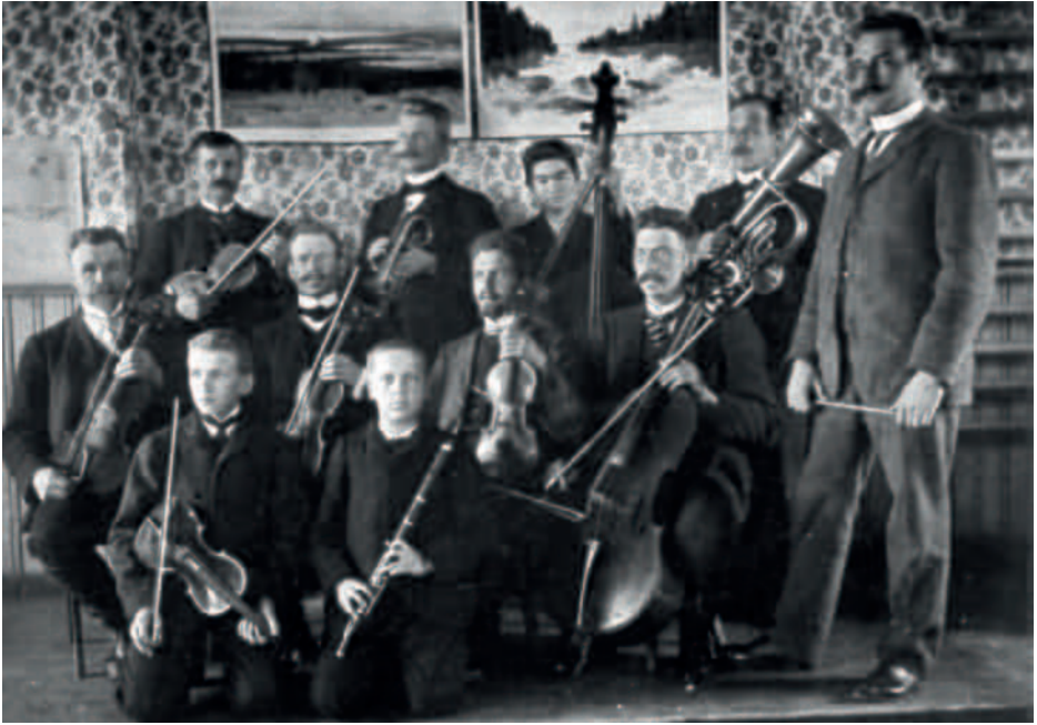
Kosken Hl orkesteri 1904 - 1908.

Muihin digitaalitalienteisiin on vain käyttöoikeudet muun muassa Kosken Kohinat-verkkojulkaisussa julkaisemista varten, ellei tallenteen omistaja ole sitä erikseen tallennetta luovutettaessa rajoittanut. Viimeksi mainittua, käyttörajoitettua digitaaliaineistoa Koski-seura ottaa kokoelmaansa vain poikkeustapauksessa seuran hallituksen tapauskohtaisella erillisellä päätöksellä.