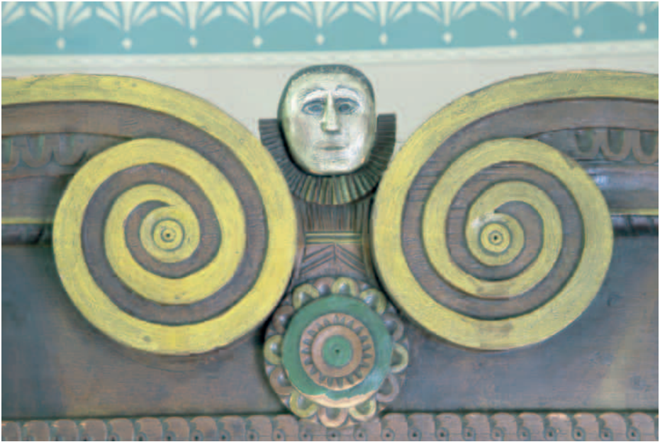
Kaapin koriste.

Esineiden vastaanottotilana toimivat lahjoituksesta riippuen kulttuuripalveluiden toimistotilat kulttuuritalolla tai kotiseutumuseon säilytystilana toimiva viljamakasiini. Esine voidaan sopimuksen mukaan myös hakea luovuttajan osoittamasta paikasta. Luovutuksen jälkeen esineen kuntoa tarkkaillaan mahdollisten museotuholaisten varalta. Kotiseutumuseolla ei ole erillistä karanteenitilaa uusille esineille.