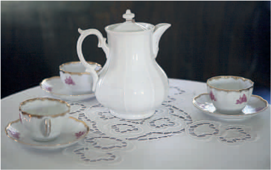
Salin kahviastiasto.

Suurin osa kotiseutumuseon esineistä on luetteloitu manuaalisesti kokoelmakorteille. Kokoelmakortteja säilytetään Orimattilan kulttuuritalossa sekä Päijät-Hämeen alueellisessa vastuumuseossa Lahdessa.