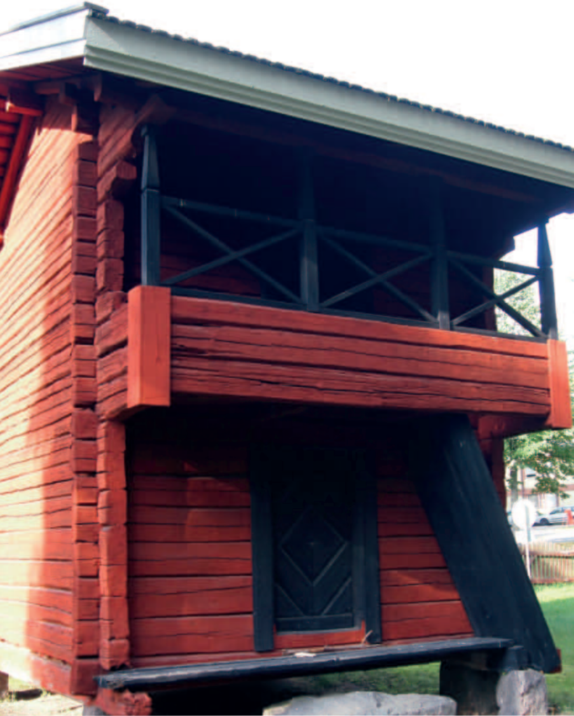
Orimattilan kotiseutumuseo Kokoelmaohjelma