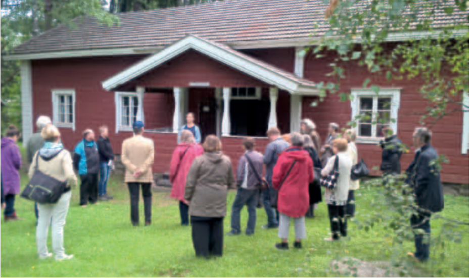
Museopäivä 2017.

Kotiseutumuseon kokoelmat ja niihin liittyvät tiedot ovat avoimia tutkijoille. Kulttuuripalveluiden henkilökunta avustaa tutkijoita aineistojen käytössä ja niihin liittyvien tietojen hankinnassa. Tarvittaessa kokoelmien tutkimuksessa voidaan hyödyntää Päijät-Hämeen alueellisen vastuumuseon palveluita.