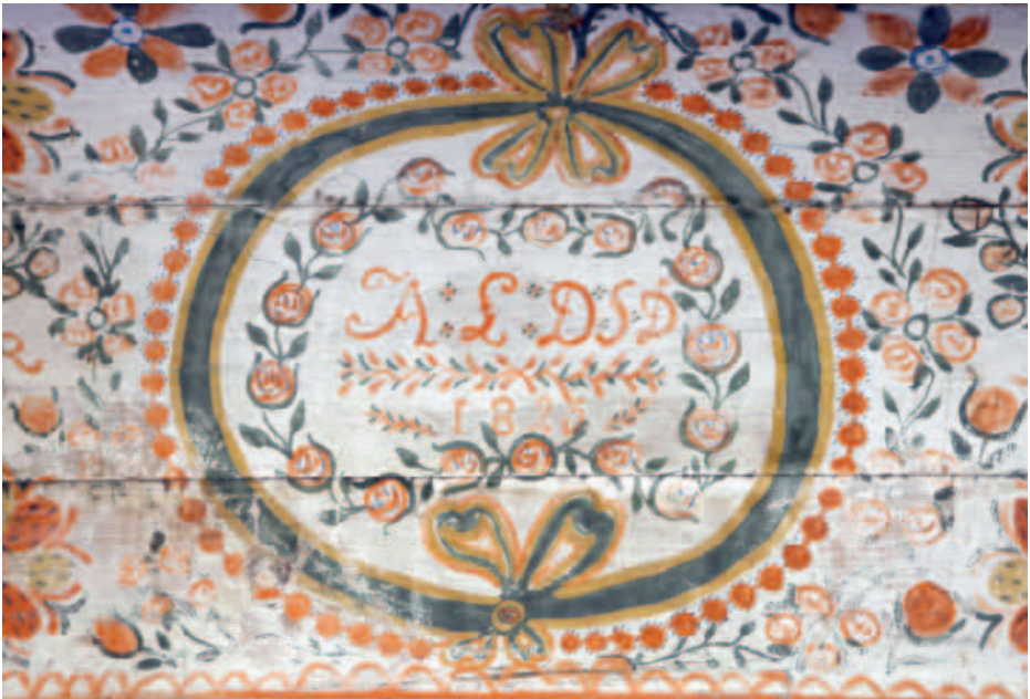
Arkun kansi.

Esineestä täytetään vastaanottotilanteessa aina vastaanottolomake, joka on samalla lahja- tai kauppakirja (liite 1). Vastaanottolomakkeessa on määritelty vastaanottoehdot. Vastaanottolomakkeesta käy ilmi, mitä aineistoa se koskee, osapuolten nimet ja yhteystiedot sekä aineiston oikeudellinen asema, eli onko kyseessä lahjoitus vai ostos, sekä mahdolliset lisäehdot. Lomakkeessa esine kuvaillaan niin, että sen voi tunnistaa ja sille annetaan diaarinumero. Vastaanottolomakkeen sivulle 3 täytetään esineen kontekstietiedot esitiedoiksi luettelointia varten. Vastaanottolomakkeen allekirjoittavat luovuttaja ja museon puolesta hankintapäätöksen tehnyt henkilö (kulttuuripäällikkö). Vastaanottolomakkeita tehdään kaksi saman sisältöistä kappaletta, joista toinen jää luovuttajalle ja toinen museolle. Museon vastaanottolomakkeita säilytetään kulttuuripalveluiden toimistossa.