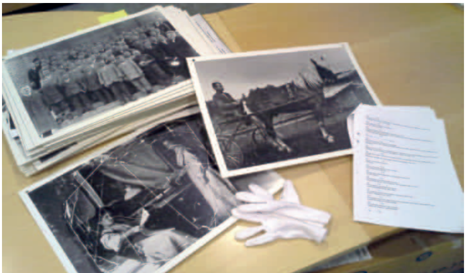
Kuvakokoelmaan kuuluvien kuvien tunnistamista inventoinnin alkuvaiheessa.

Inventointivuonna kuvien kokonaismäärä oli n. 19 000 kappaletta, mutta projektin aikana tiedon levitessä materiaalia saatiin lisää, ja nykyisellään kuvia eri muodoissa on jo yli 20 000 kappaletta. Toisaalta osa kuva-aineistosta on poistettava kokoelmasta sinne kuulumattomana, mutta poistot toteutetaan vasta kun poistoperusteet on kirjattu koelmaohjelmaan ja hyväksytyt.