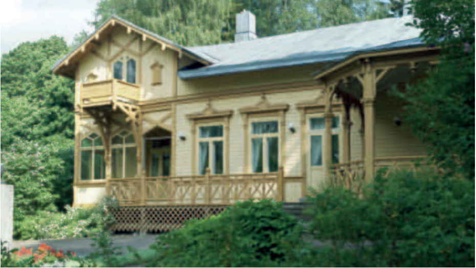
Danielson-Kalmarin huvila.

henkilökohtaisia tavaroita sitoumuksella, että mikäli kunta tarvitsee huvilaa muihin tarkoituksiin, esineet siirretään Hartolan museoon ja Kansallismuseoon. Museohuoneita perustettiin kaksi, toinen huoneista kunnostettiin esittämään J. R. Danielson-Kalmarin työhuonetta, toinen taas perheen ruokailutilaa. Museo avattiin yleisölle vuonna 1957, ja avaamisen yhteydessä esitettiin Kalmarin kesäteatterin ensimmäinen näytelmä Kuninkaanpäivä Anianpellossa. Tuolloin museon sisäänkäymäksy oli 30 penniä.