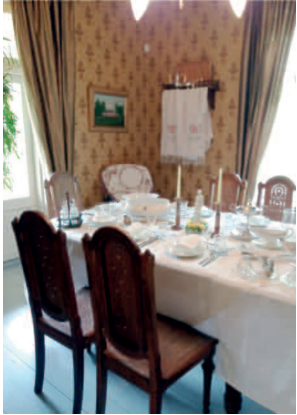
Vuonna 2017 uudistettu näyttely Danielson-Kalmarin perheen ruokasalia esittävässä museuhuoneessa.

Tällaisia astioita ovat mm. suurikokoinen Lotta Svärd -tarjoiluastia, muut tarjoiluastiat ja ruokalautaset. Lasisia viilikulhoja on saatettu käyttää jälkiruoka-astioina. Astioiden joukossa on myös kolme pienikokoista kahvikannua ja kolme kermanekkaa sekä kaksi pienikokoista sokerikkoja, kaikki metallisia. Nämä kahvitarjoiluun liittyvät astiat on tarkoitettu vieraiden kestitsemiseen omiin pöytiinsä tarjoillen. Aterimista veitset ja haarukat ovat terästä, sen sijaan lusikat on valmistettu alumiinista tai lentokonemetallista. Ruokailuvälineiden alkuperästä tai hankinnasta ei toistaiseksi ole löytynyt mainintaa, mutta ne ovat ajallisesti autenttisia, siis peräisin ajalta, jolloin huvila on ollut Danielson-Kalmarin perheen käytössä.