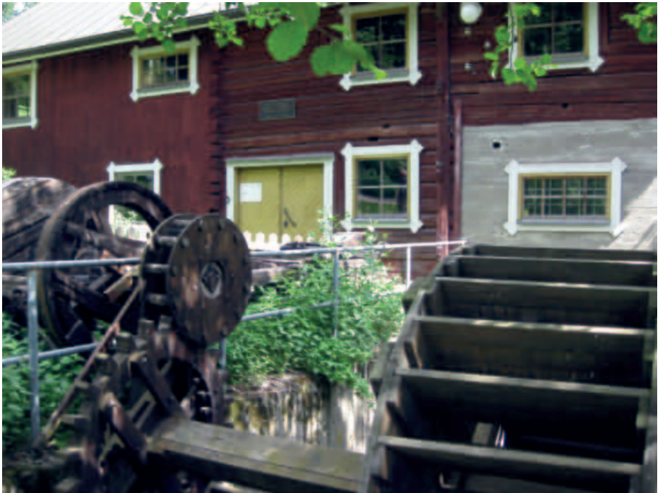
Vääksyn vesimyllymuseo.

Vääksynjoessa on kirjallisten tietojen mukaan ollut myllyjä jo 1400-luvulla. Vielä 1950-luvun lopulle asti Vääksynjoessa oli useampi mylly. Leinon myllyksi kutsuttu Anianpellon mylly paloi 1950-luvun lopulla. Nykyisellään jäljellä on Anianpellon myllyn kiviperustus ja kiviportaat sekä nykyinen Vesimyllyn rakennus. Vesimyllyssä oli viimeksi jauhettu viljaa vuonna 1955, ja kunnan omistukseen mylly siirtyi vuonna 1977. 8