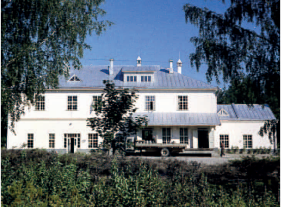
Vääksyn Osuusmeijeri 1960-luvun alkupuolella.

Kokoelmaohjelma hyväksytään hyvinvointilautakunnassa välittömästi sen valmistuttua, ja sen jälkeen sitä tarkastellaan valtuustokausittain. Tämä voimassa oleva kokoelmaohjelma on hyväksytty hyvinvointilautakunnassa 13.5.2020.