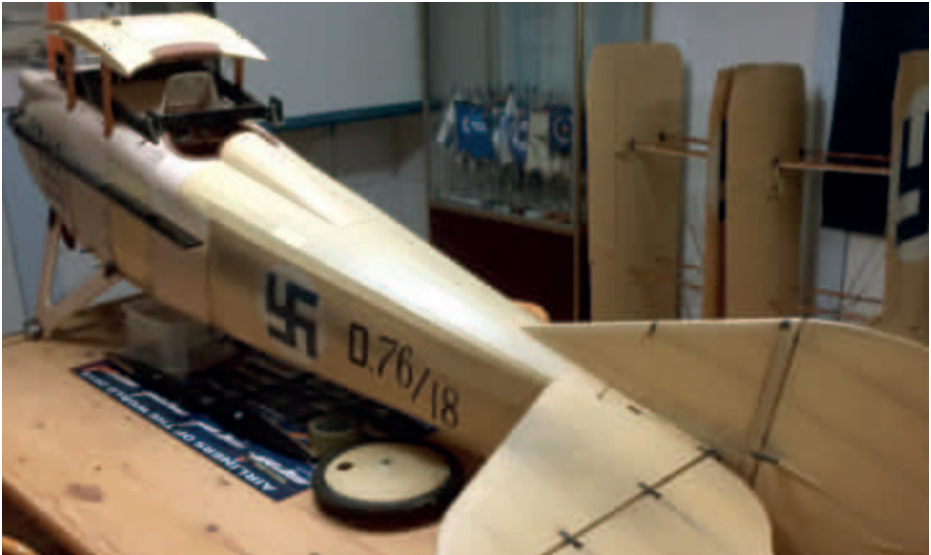
Mittakaavalennokki ilmavoimien yhdestä ensimmäisestä lentokoneesta SPAD C.VII reg. D.76/18.

Kokoelmaan otolla tässä tarkoitetaan esinettä tai muuta materiaalia, joka otetaan LIS omaisuudeksi. Sen sijaan museossa näytteillä olevat Sotamuseon tai PVLOGL:n materiaali ei ole LIS:n omaa kokoelmaa, vaan ovat deponoituna P-HIMIin.