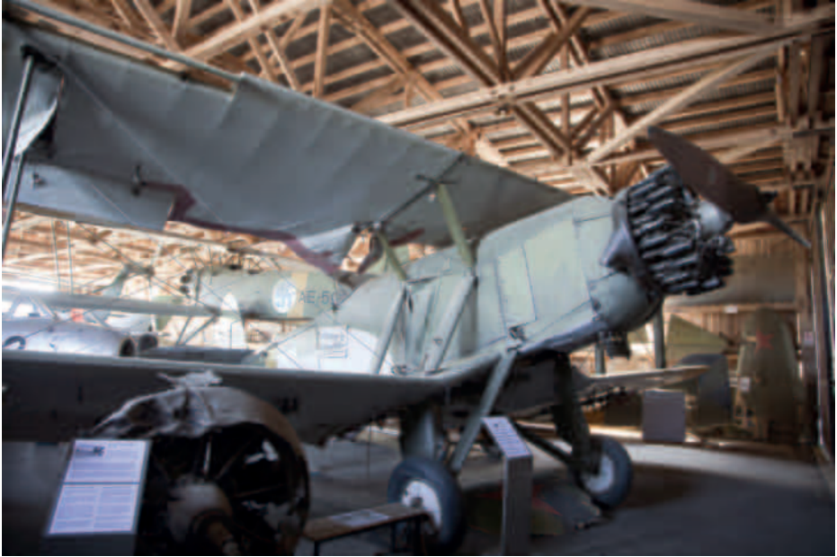
Koneita Päijät-Hämeen ilmailumuseon museohallissa..

Vastaanotettaessa täytetään vastaanottolomake (Liite 1), joita löytyy P-HIM:ltä tai Siltatuvalta dokumenttikansioista. Täytetty ja allekirjoitettu lomake tallennetaan Siltatuvalle kansioon. Esineestä ja lahjoittajasta kerrotaan tarvittavat tiedot (ei lahjoittajan henkilötietoja) LIS:n hallituksen jäsenille, hallimestarille ja arkistonhoitajalle. Arkistonhoitaja kirjaa lomakkeen tiedot MS Excelillä tehtyyn taulukkoon, missä pidetään järjestysnumerollista luetteloa LIS:n omistamista ja hallinnoimista esineistä. Esineeseen liitetään tunnistelappu, jossa kerrotaan sen omistaja, haltija tai muu omistustieto, mutta ei lahjoittajan tai entisen omistajan yhteystietoja. Arkistonhoitajan tulee tietoja tallettaessaan huomioida henkilörekisterilaki ja sen vaatimukset.