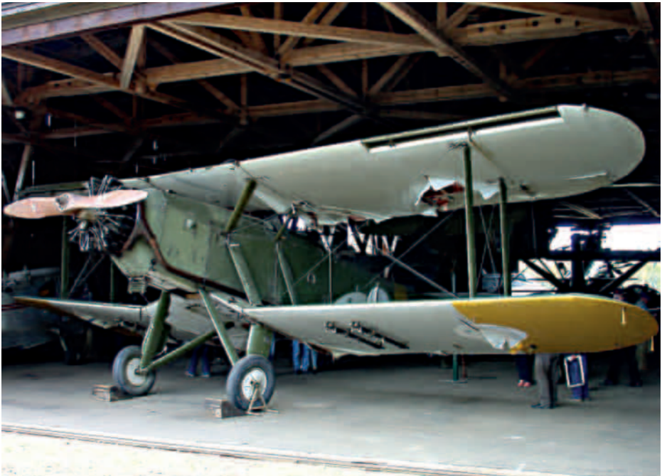
Blackburn Ripon.

Vesivehmaan varastohallin järjestelyistä on vastannut 1960-luvulta alkaen Lahden Ilmasilta (LIS). Vuosina 1947–1962 koneiden kunnosta ja säilytyksestä vastasi Ilmavoimat. Perustamisensa 15.11.1962 jälkeen LIS otti tehtäväkseen huolehtia museokoneista ja sen jäsenet aloittivat hallissa olevien koneiden ja niiden osien luetteloinnin. Ilmailumuseotoiminnan alettua Suomessa 1970 luvun aikana, on Vesivehmaan hallista siirretty ilmailumuseoihin entisöinnin kautta yli 30 konetta ja satoja ellei tuhansia muita osia eri entisöintiprojekteihin. Museaalinen vastuu kokoelmasta oli vuosina 1969–1996 Ilmailumuseoyhdistyksellä (IMY) ja sen jälkeen vuoteen 2005 saakka