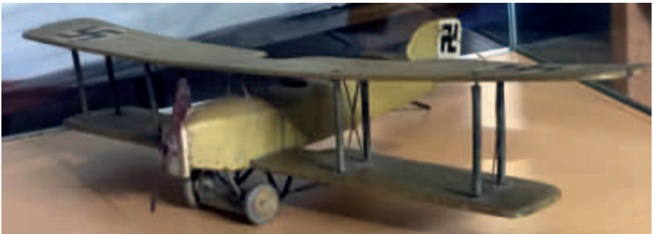
Breguet 14 pienoismalli, lahjoitettu LIS / P-HIM kesäkuussa 2019.

Jos osa tai artikkeli on jo museon kokoelmassa, tehdään päätös liittamisestä arvioimalla lahjoitettavan osan kuntoa silmämääräisesti. Tarjottua osaa verrataan jo olemassa olevaan osaan, ja jos tarjottu on parempikuntoinen, se otetaan kokoelmaan.