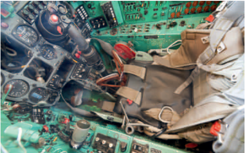
Koneen ohjaamo.

Kokoelmaan voidaan liittää esine esimerkiksi lahjoituksen tai oston kautta. Kokoelmaan liittäminen tapahtuu vasta, kun kohde on päätetty (kriteerien ja arvoluokituksen avulla) hyväksyä kokoelmaan. Esityksen kokoelmaan otosta voi tehdä Lahden Ilmasillan jäsen, P-HIM:n museopäivystäjä, LIS:n hallituksen jäsen, hallimestari tai muu LIS:n vastuhenkilö. Kaikki LIS/P-HIM:n kokoelmaan otettavat esineet hyväksyy LIS:n puheenjohtaja, hänen estyneenä ollessa varapuheenjohtaja. Isommissa esineissä ja kokonaisissa lentokoneissa päätöksen tekee LIS:n hallitus puheenjohtajan tai varapuheenjohtajan esityksestä.