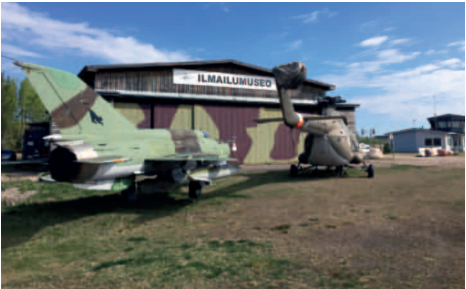
Päijät-Hämeen ilmailumuseo. Kuva Hannu Iivarinen.

Tämän ohjelman käyttöön on hyväksynyt LIS ry:n hallitus kokouksessaan 7.10.2019. Tämä ohjelma on voimassa 31.12.2022 saakka. Ohjelmaa voidaan päivittää tarvittaessa ennen voimassaolon päättymistä. Ohjelma päivityksestä päättää LIS:n hallitus.