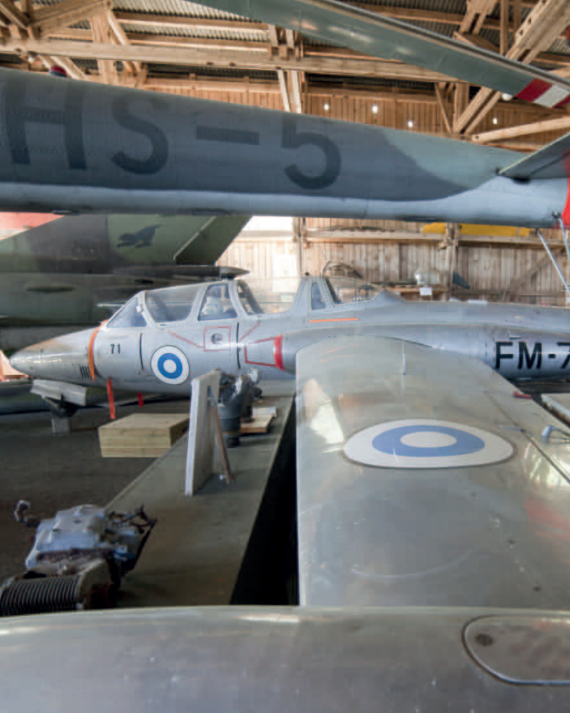
Päijät-Hämeen Ilmailumuseo Kokoelmaohjelma