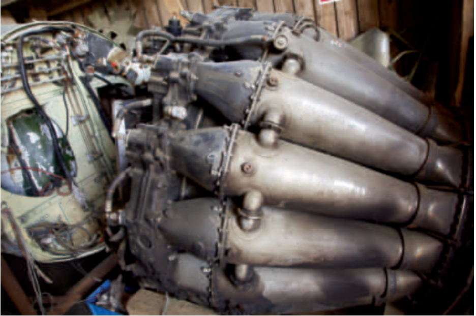
Kokoelmaesine Päijät-Hämeen ilmailumuseossa.

esineen palauttamista sen lahjoittajalle. Mikäli lahjoittajaa tai hänen jälkeläisiään ei tavoiteta helposti, voidaan esineelle etsiä muu vastaanottaja. Lähtökohtaisesti esinettä ei myydä yksityisille keräilijöille suoraan, vaan esimerkiksi julkisella huutokaupalla. Tuotto esineen myynnistä ohjataan P-HIM:n toimintaan.